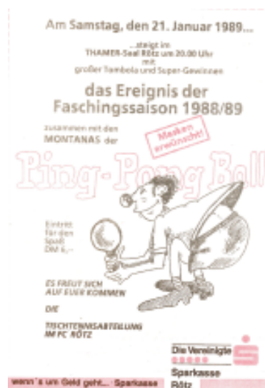
In den 80er Jahren veranstaltete die Abteilung Tischtennis mehrmals den Ping-Pong-Ball.